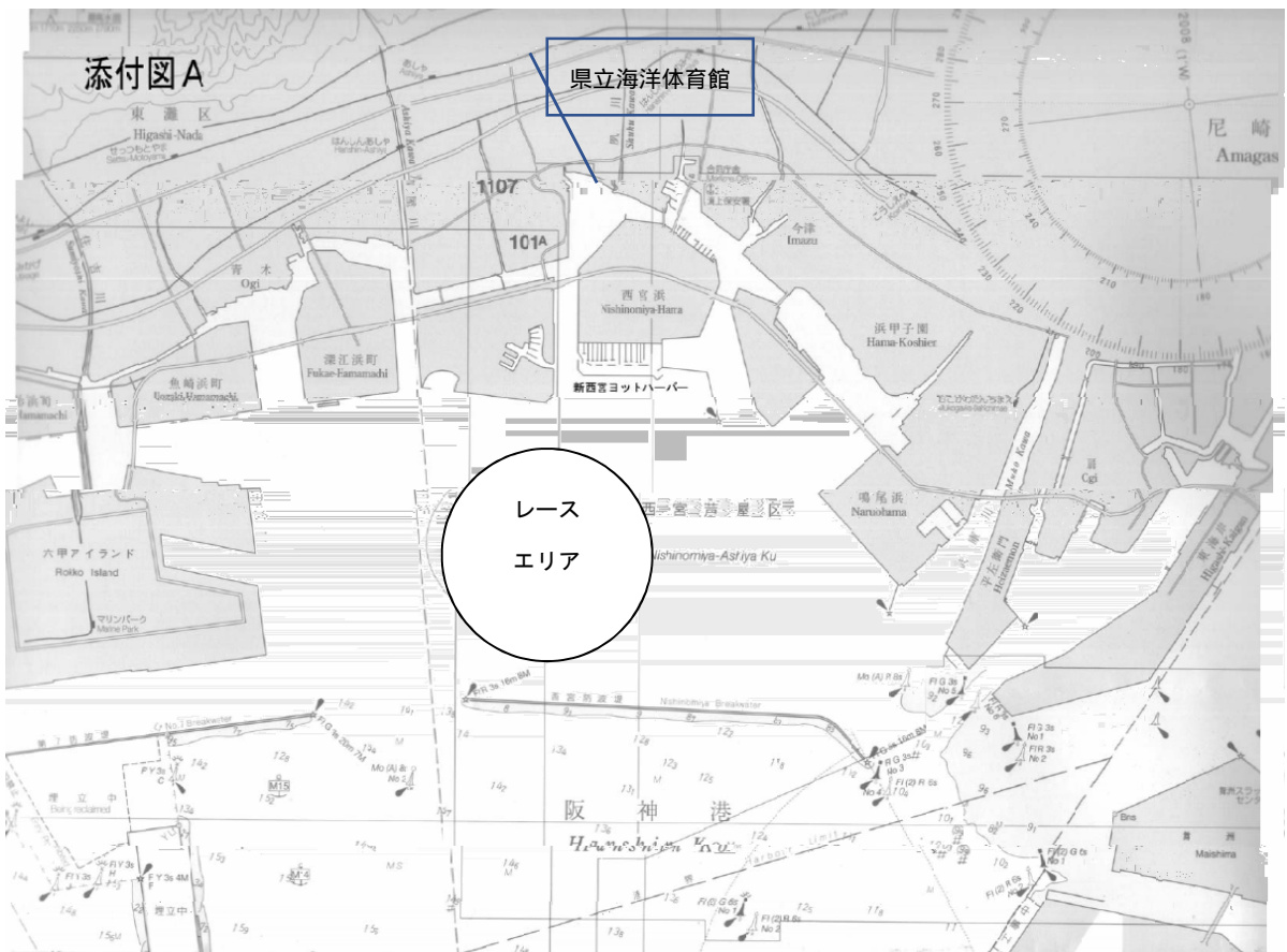
【添付図A】レース・エリア